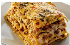
GRAN GALÀ DEL PASTICCIO

tel. 0499930128 int.9 - www.facebook.com/ComuneTorreglia